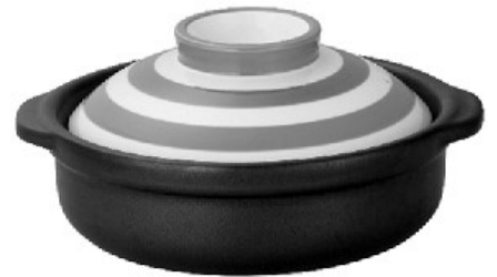
直火、レンジ、オーブンに対応した K-ai(ケーアイ)のおしゃれな土鍋

土鍋の出番が多くなるこれからの季節、鍋料理だけでなく定番料理も土鍋で作ってみませんか。土鍋の応用範囲は思いのほか広く、煮込む以外にも、焼いたり、炒めたり、蒸したりと、土鍋ひとつで何でもできます。土鍋で調理すると肉や野菜などをじっくり加熱できるので素材が柔らかくなり、味もまろやか。今では土鍋用のレシピ本もたくさん出ています。この冬は、パン、焼き芋、グラタン、親子丼、ステーキ、スープパスタなども土鍋で作ってみませんか。今回は家庭料理の定番「肉じゃが」です。材料を土鍋に放り込むだけでおいしく仕上がりますよ。