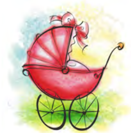
ベビーカーはレンタルで!

レンタル日数は基本的に1泊2日から1日単位で設定できます。一部を除くベビー用品は1ヶ月単位の料金設定で、長期レンタルの割引も用意されています。申し込みはインターネットかカタログから。インターネットの場合、申し込んだら希望の店舗で受け取り・返却します。カタログは無料で取り寄せ、店舗に直接電話をするか来店します。希望日に配達・引き取りをしてくれる宅配サービス(有料)もあり、ケータイやスマホからも利用できるのが便利です。