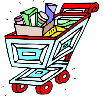
無駄買いしてませんか？

じょうなストックが台所の棚を占領していませんか。値段優先で必要以上の買い物をするのはまったくの無駄買いです。