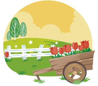
思い出の場所に「ふるさと納税」