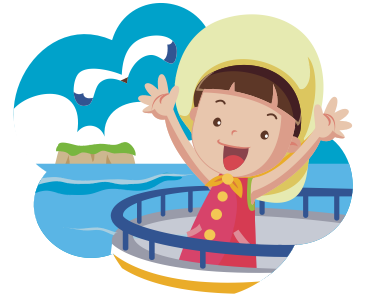
モニター旅行で お得旅に行ってきます！

今年から新たに、「シルバーウィーク（S W）」と呼ばれる大型連休が始まりました。日付の並びから、初実施は9月19日～23日の5連休です。これを機に旅行の計画を考えている方も多いでしょうね。今回はひとつのご提案として、モニター