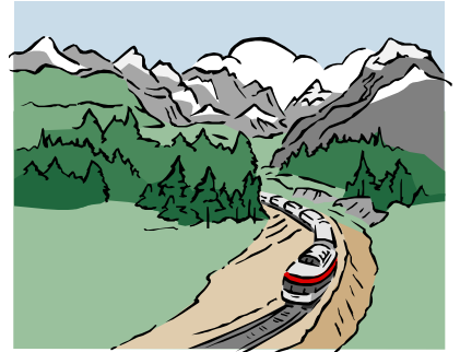
たまにはのんびり汽車の旅

になっており、1人で5日間使っても、5人一緒に1日で使ってもかまいません。夏の販売は7月1日～8月31日。利用期間は7月20日～9月10日です。