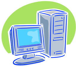
「二台目のパソコン」ならいいかもしれないけど...